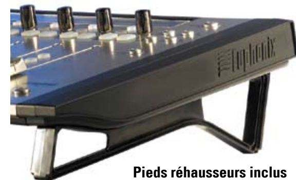
Pieds réhausseurs inclus pour augmenter la hauteur et l'angle de vue